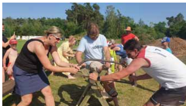
RODINNÝ PĚTIBOJ - řežeme, řežeme