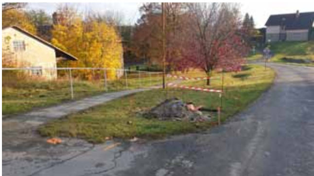
Chodník 3.etapa - Před zahájením prací v úseku nad Tiskárnou