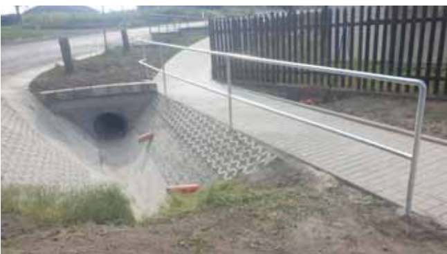
Chodník 3.etapa - Dokončení spodní části, úprava propustku a koryta