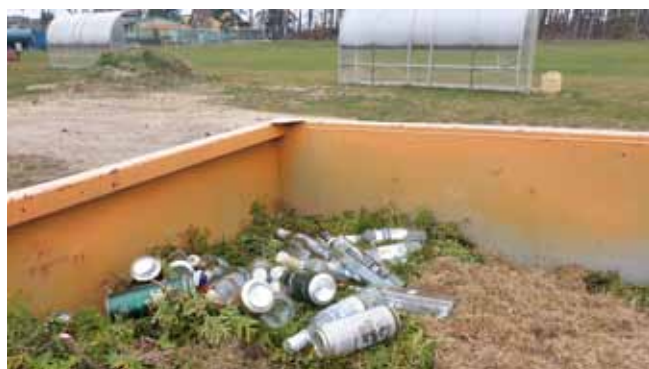
Sběrné místo na hřišti - detail obsahu