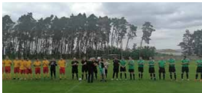
Předseda oddílu - 70. narozeniny, dodatečně blahopřejeme!