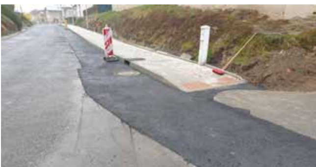
Chodník a V.O. 1.etapa - Dokončení prací na tomto úseku