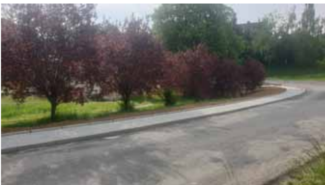
Chodník 3.etapa - Dokončení úseku nad Tiskárnou