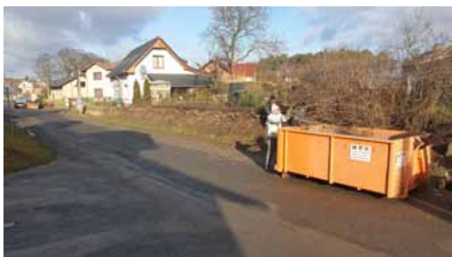
Chodník a V.O. 1.etapa - Zahájení prací na této části