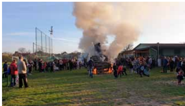
A již upalujeme....