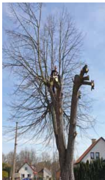
Ošetření stromů - Na Týnci

Kontrola, ošetření a ořezy obecních stromů: v průběhu měsíce dubna bylo po celé obci Čistá ošetřeno celkem 29 stromů. Pravidelné kontroly probíhají 1x za dva roky.