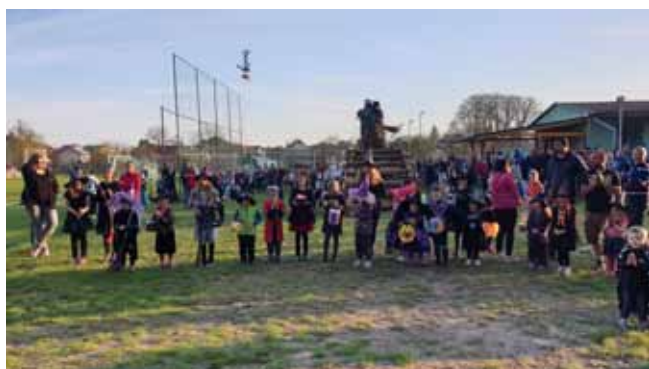
Vyhlašování nejpovedenějších masek