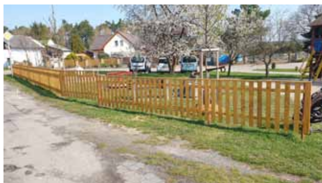
NOVÉ OPLOCENÍ na Dětském hřišti na Týnci - a máme dokončeno

Kontrola, ošetření a ořezy obecních stromů: v průběhu měsíce dubna bylo po celé obci Čistá ošetřeno celkem 29 stromů. Pravidelné kontroly probíhají 1x za dva roky.