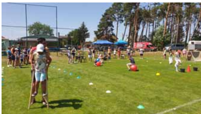
DĚTSKÝ DEN - soutěže pro nejmenší, pomoc rodičů

Za Kulturní výbor Danuše Horáčková, Jaroslav Martinec a Jana Uhlířová