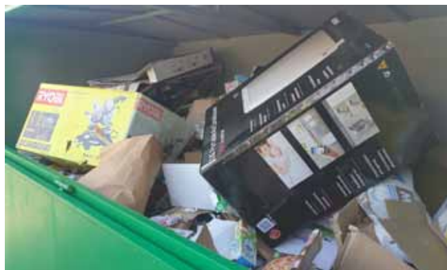
Sběrný dvůr - takto se do kontejneru mnoho nevejde