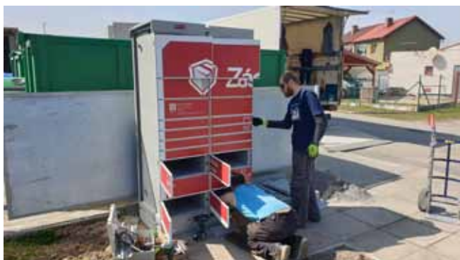
Z-BOX u Domu služeb - Průběh instalace

Umístění Z-BOXU společnosti Zásilkovna s.r.o. Praha: v dubnu tohoto roku byl u Domu služeb v blízkosti Sběrného dvora ve spolupráci obce Čistá se společností Zásilkovna Praha nainstalován Z-BOX, tedy automat sloužící k vydávání zásilek a poskytování dalších služeb, které provozovatel jako podnikatel v oblasti přepravovaných služeb nabízí.