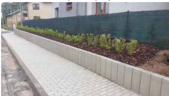
Chodník a V.O. 1.etapa - Dokončení prací této části