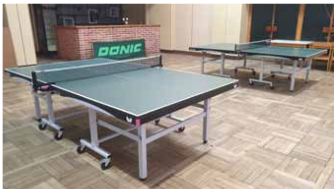
Stolní tenis - NOVÉ HRACÍ STOLY BUTTERFLY