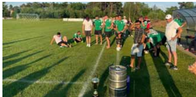
Odměny za 2.místo v okresním poháru