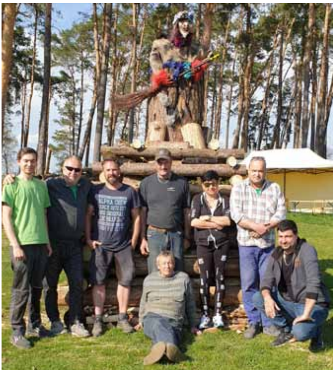
BABA JAGA a křoví

Po dvou letech nucené pauzy se na mnoha místech opět 30. dubna rozhořely vatry a ohně, na nichž se upalovaly čarodějnice. Naše obec nezůstala pozadu a filipojakubská noc odstartovala lampionovým průvodem od kulturního domu na fotbalové hřiště. Tam byla zapálena vatra s čarodějnici tentokrát v podobě „baby jagy“. Pro děti byl připraven táborák, kde si opékaly špekáčky. Pro zpestření programu nám hrála a zpívala kapela Mystiq. Počasí bylo příjemné, přilákalo velké množství rodičů s dětmi. Můžeme říct, že se akce vydařila.