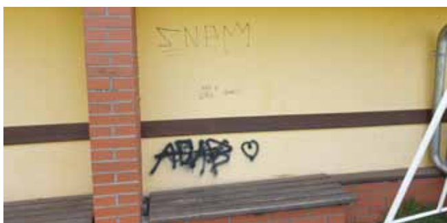
Autobusová zastávka Čistá Hřiště - opět grafická úprava

A NĚKOLIK FOTOGRAFIÍ NA ZÁVĚR, TAK, JAK BY TO NEMĚLO VYPADAT