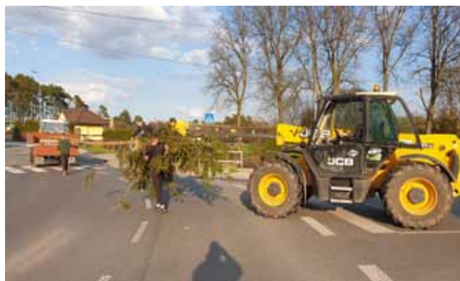
MÁJKA - složitá doprava z lesa