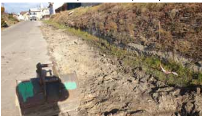
Chodník a V.O. 1.etapa - Zahájení prací na tomto úseku