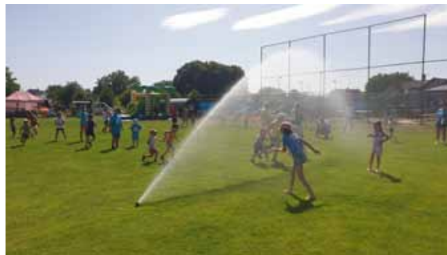
DĚTSKÝ DEN - jedna z největších atrakcí