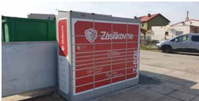
Z-BOX u Domu služeb - Ukončení instalace, předání do užívání

A NĚKOLIK FOTOGRAFIÍ NA ZÁVĚR, TAK, JAK BY TO NEMĚLO VYPADAT