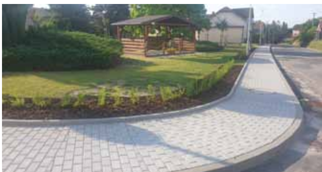
Chodník a V.O. 1.etapa - Dokončení prací u parčíku KD