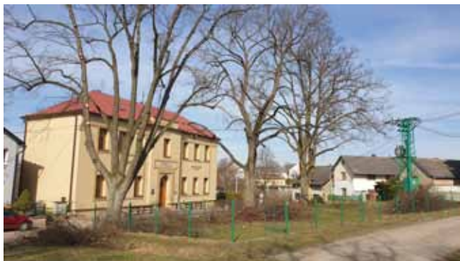
Ošetření stromů v obci - U Základní školy

Umístění Z-BOXU společnosti Zásilkovna s.r.o. Praha: v dubnu tohoto roku byl u Domu služeb v blízkosti Sběrného dvora ve spolupráci obce Čistá se společností Zásilkovna Praha nainstalován Z-BOX, tedy automat sloužící k vydávání zásilek a poskytování dalších služeb, které provozovatel jako podnikatel v oblasti přepravovaných služeb nabízí.