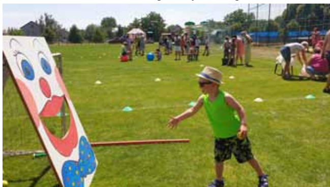
DĚTSKÝ DEN - zarputilost dětem nescházela