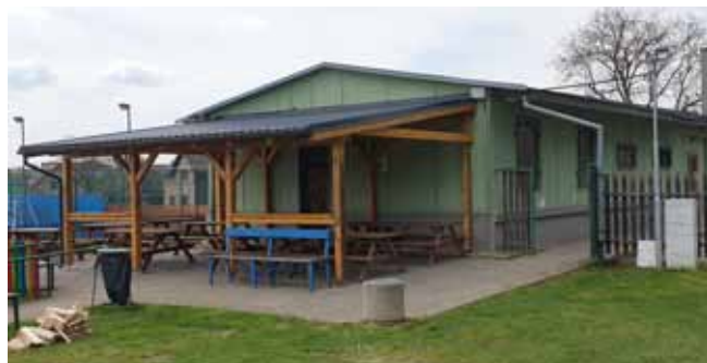
Přístřešek u kabin - NOVÁ STŘECHA A NOVÉ STOLY

Nové oplocení víceúčelového hřiště a dětského hřiště na Týnci: v měsíci květnu byla na čelní straně víceúčelového hřiště s umělým povrchem dokončena výměna 1. části stávajícího zastaralého a poničeného oplocení za nové.