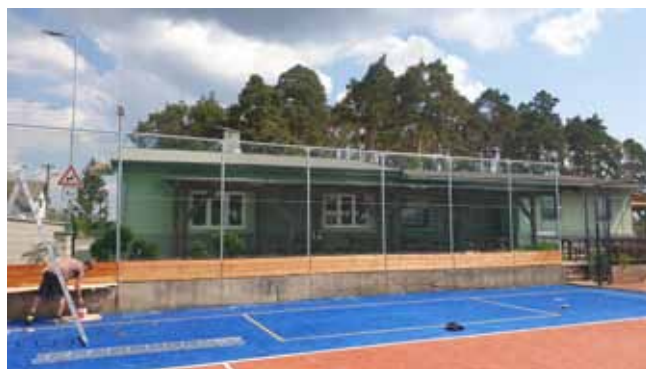
NOVÉ OPLOCENÍ - Víceúčelové hřiště a NOVÁ STŘECHA na Pergole

Též v dubnu byly provedeny revize na všech dětských hřištích a dětských koutcích odborným pracovníkem.