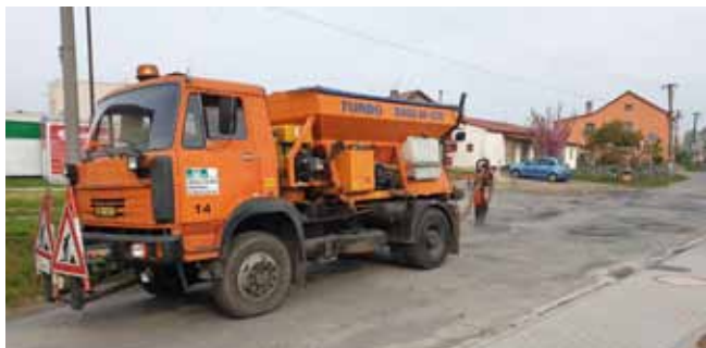
Opravy místních komunikací

Údržba místních komunikací po zimním období: průběhu měsíce května byly opraveny místní komunikace. Víme, že všechna místa nejsou opravena tzv. do ideální podoby, ale s přihlédnutím k tomu, že obec připravuje realizaci stavby splaškové kanalizace, rozhodli jsme se opravovat pouze nezbytně nutné.