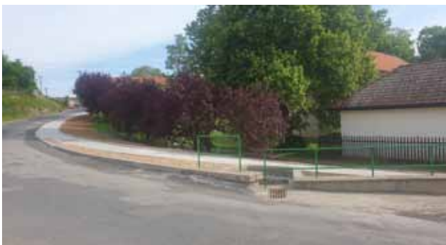
Chodník 3.etapa - Dokončení úseku u propustku