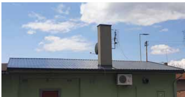
Restaurace na Hřišti - NOVÁ STŘECHA

Sportovní areál na hřišti – Restaurace, pergola, přístřešek: v tomto období bylo také provedeno výrazné zlepšení prostředí ve sportovním areálu. Byla kompletně opravena střecha na restauraci, byla vyměněna střešní krytina na pergole u restaurace a také byla namontována nová střešní krytina na nově vybudovaném přístřešku u vstupu do fotbalových kabin. Byly také zakoupeny nové lavice se stoly, které jsou umístěny pod novým přístřeškem.