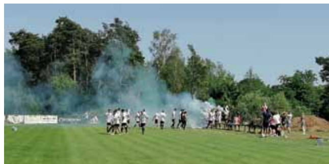
Podpora fanoušků v posledním zápase