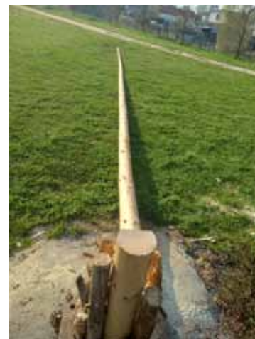
MÁJKA - z pěkné Májky jsme se těšili pouze krátce....