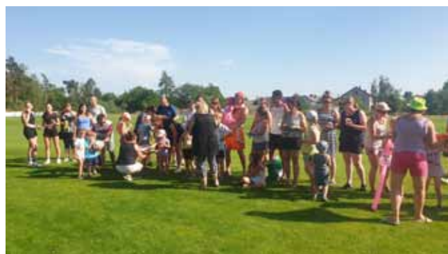
RODINNÝ PĚTIBOJ - Vyhlášení výsledků, rozdání cen