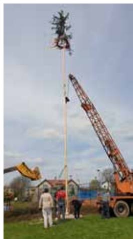
MÁJKA - již je postaveno