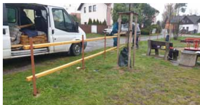
NOVÉ OPLOCENÍ na Dětském hřišti na Týnci - průběh prací