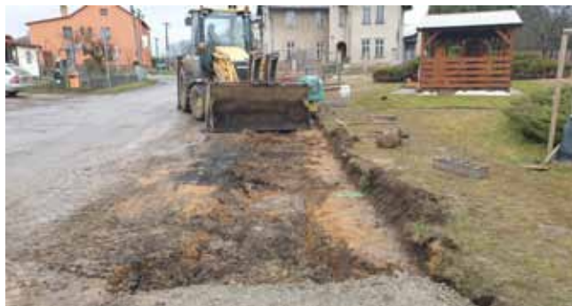
Chodník a V.O. 1.etapa - Zahájení prací u parčíku KD