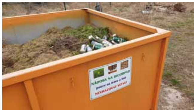
Sběrné místo na hřišti - Kontejner na bioodpad