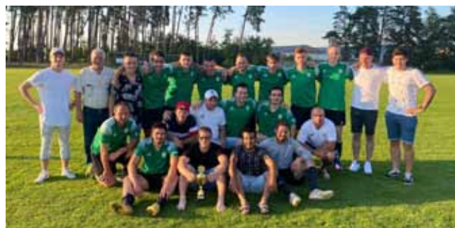
Mužstvo dospělých FK Slavoj Čistá 2021-2022