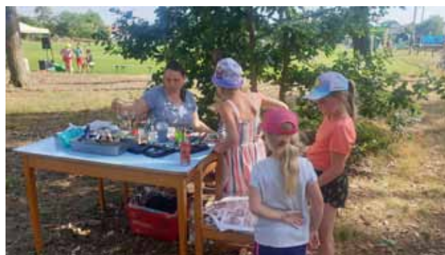
DĚTSKÝ DEN - Malování na obličej