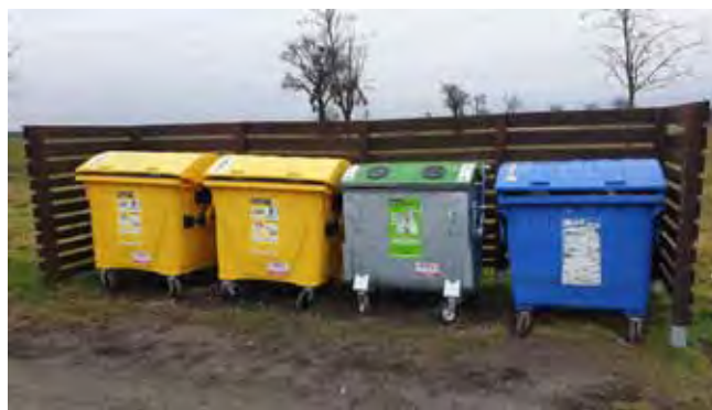
Sběrné místo na Stránce - starý stav, před zahájením prací

Sběrné místo v místní části Stránka: v letním období jsme na místní části Stránka vybudovali zpevněnou plochu pro kontejnery na komunální a ostatní odpady a opravili jsme oplocení sběrného místa.