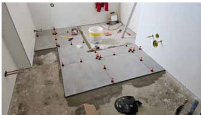
Sociální zázemí - průběh prací, pokládka dlažby