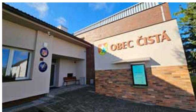
Venkovní pohled na OÚ Čistá