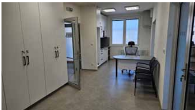
Prostory OÚ - Recepce, Kuchyňský kout