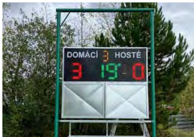
Sportovní areál, oddíl kopané - Nová světelná výsledková tabule - zahájení provozu

Sportovní areál, oddíl kopané: jak zcela jistě všichni víte, naši muži se na jaře stali vítězové III. třídy okresu Mladá Boleslav a postoupili do vyšší soutěže, a to do Okresního přeboru, kde se mj. střetnou s týmy mužů z Bělé pod Bezdězem a Bakova nad Jizerou. Odměnou za tento výborný výsledek ze stran Obce Čistá je pořízení nové světelné výsledkové tabule.