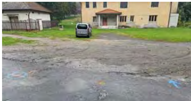
Čistá, výstavba kanalizace - přípravné práce

Chci vás všechny opětovně požádat, abyste vy, kteří budete mít v průběhu stavby možnost svá vozidla parkovat u vašich domů, parkujte vozidla na svých pozemcích, a NE A NA ULICÍCH. Buďte ohleduplní.