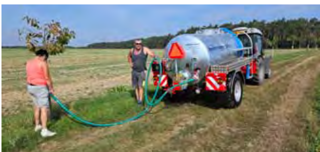
Nový Fekální návěs - závlivka nově vysázených ovocných stromků