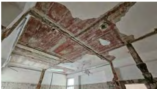
Sociální zázemí - po odstanění podhledu, havarijní stav stropu