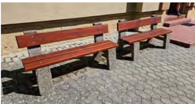
ZŠ Čistá - oprava laviček před budovou

Základní škola Čistá: v letním období byla provedena oprava laviček, dále byla provedena oprava zámkové dlažby u vstupu a také byla nově umístěna stojanová Cyklo-mapa, kterou svými obrázky doplnili naši žáci.