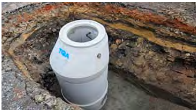
Čistá, výstavba kanalizace - průběh prací, první instalovaná šachta