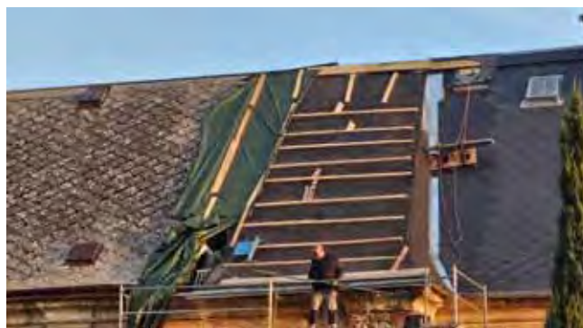
Kostel sv. Vavřince, oprava střechy 2.etapa - Průběh prací