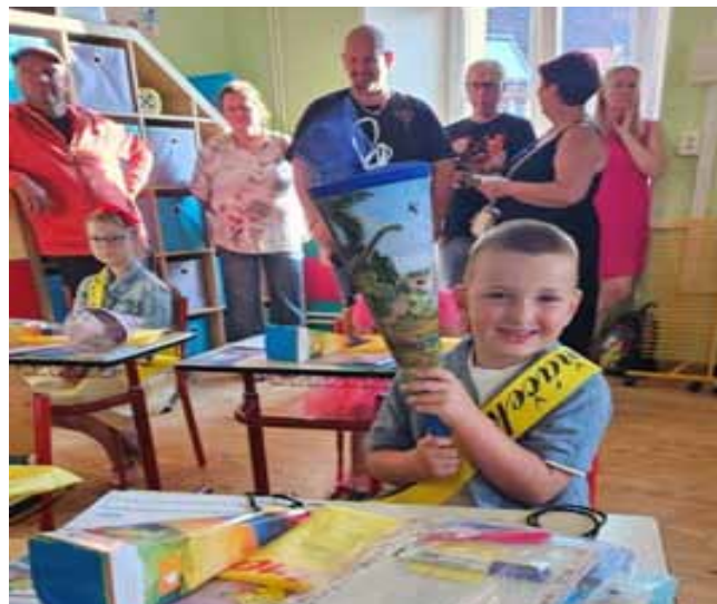
Prvňáčci si poprvé sedli do lavic