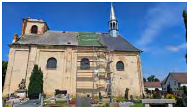
Kostel sv. Vavřince, oprava střechy 2.etapa - zahájení prací