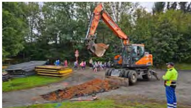
Čistá, výstavba kanalizace - 1.10.2024, zahájení prací pod dohledem žáků ze ZŠ Čistá