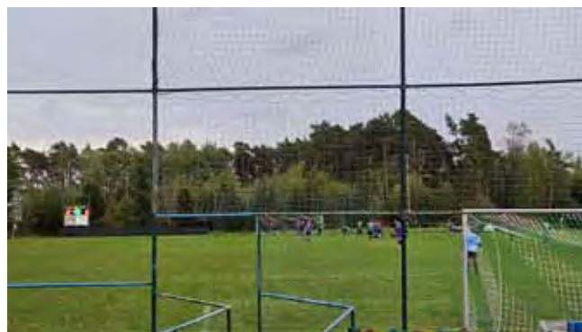
Sportovní areál, oddíl kopané - Nová světelná výsledková tabule již v provozu při fotbalovém utkání našich mužů