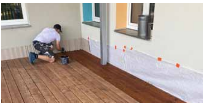
MŠ Čistá - oprava nátěru podlahy v pergole, průběh prací

Mateřská škola Čistá: v letním období byla provedena oprava nátěru podlahy v pergole a také byly provedeny opravy herních prvků.