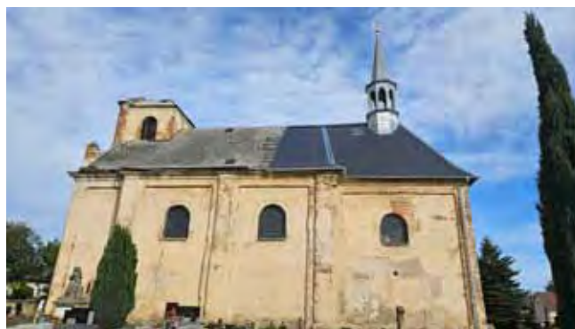
Kostel sv. Vavřince, oprava střechy 2.etapa - Ukončení prací

Na této části opravy střechy bylo provedeno sejmutí a likvidace staré střešní krytiny, byla opravena další část