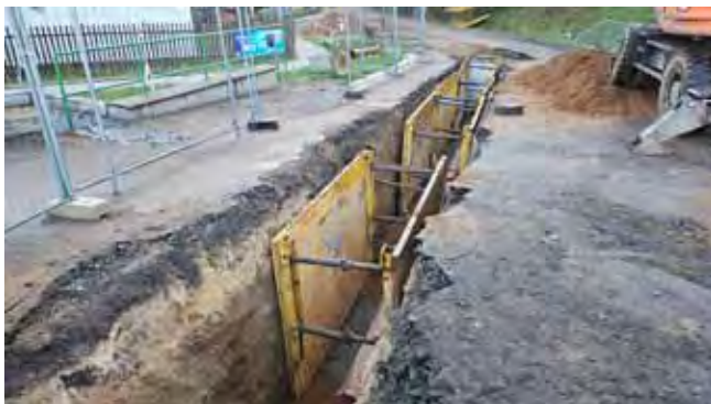
Čistá, výstavba kanalizace - průběh prací nad místní Tiskárnou

Dále vás chci všechny znovu požádat, respektujte dopravní značení a omezení.