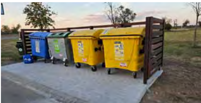
Sběrné místo na Stránce - dokončení prací, dílo se zdařilo!

Nový Fekální návěs: pro potřeby obce jsme zakoupili nový Fekální návěs pro závlivku zeleně v obci, zejména na závlivku nově vysázených stromků.