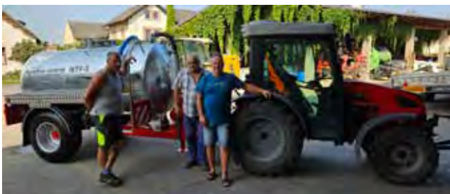
Nový Fekální návěs - Předání a převzetí návěsu

Nový Fekální návěs: pro potřeby obce jsme zakoupili nový Fekální návěs pro závlivku zeleně v obci, zejména na závlivku nově vysázených stromků.