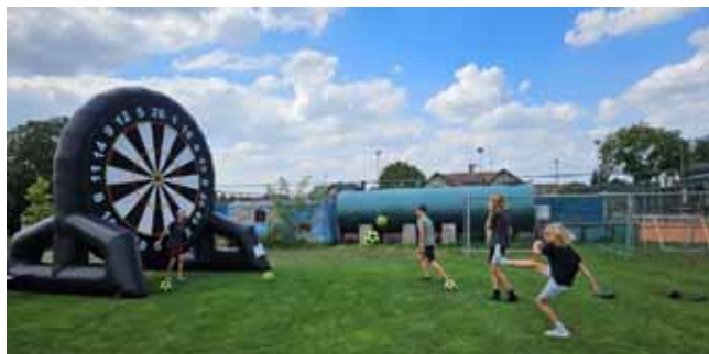
Rozloučení s létem-nafukovací terč

Program akce nabídl řadu aktivit, které potěšily návštěvníky všech věkových kategorií. Hlavními lákadly byly zorbing a obří skluzavka do vody. Zorbing, což je průhledná koule, do které, mohli návštěvníci vstoupit a zkoušet se kutálet po vodě, vzbuzoval smích a radost, zatímco obří skluzavka přilákala zejména děti, které se s nadšením vrhaly do osvěžující vody. Další atrakcí byl obří nafukovací terč, ale místo šipek se na něj házelo balony.