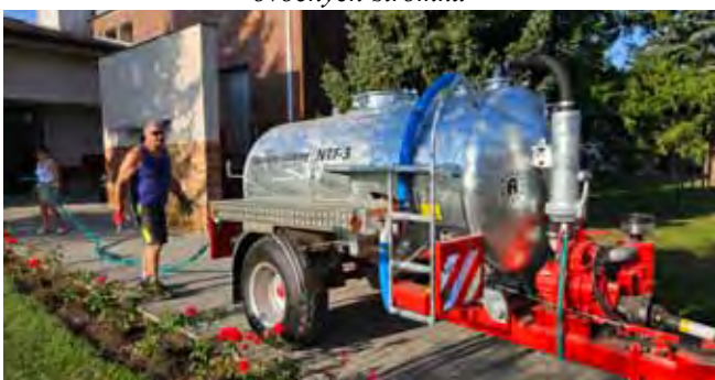
Nový Fekální návěs - závlivka růží u OÚ Čistá

Sportovní areál, oddíl kopané: jak zcela jistě všichni víte, naši muži se na jaře stali vítězové III. třídy okresu Mladá Boleslav a postoupili do vyšší soutěže, a to do Okresního přeboru, kde se mj. střetnou s týmy mužů z Bělé pod Bezdězem a Bakova nad Jizerou. Odměnou za tento výborný výsledek ze stran Obce Čistá je pořízení nové světelné výsledkové tabule.