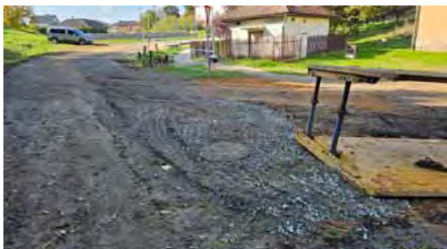
Čistá, výstavba kanalizace - dokončení 1.části, Stoka A