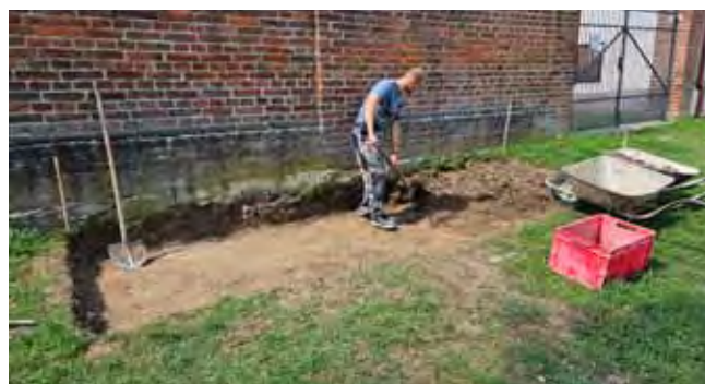
Zpevněná plocha před hřbitovem - zahájení prací

Úprava plochy pro kontejner a lavičku před hřbitovem: zde jsme vybudovali zpevněnou plochu pro umístění kontejneru na odpad a pro umístění lavičky.