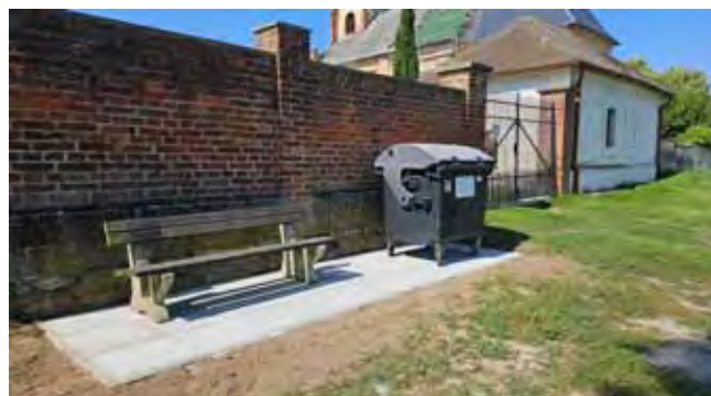
Zpevněná plocha před hřbitovem - dokončení prací

Sběrné místo v místní části Stránka: v letním období jsme na místní části Stránka vybudovali zpevněnou plochu pro kontejnery na komunální a ostatní odpady a opravili jsme oplocení sběrného místa.