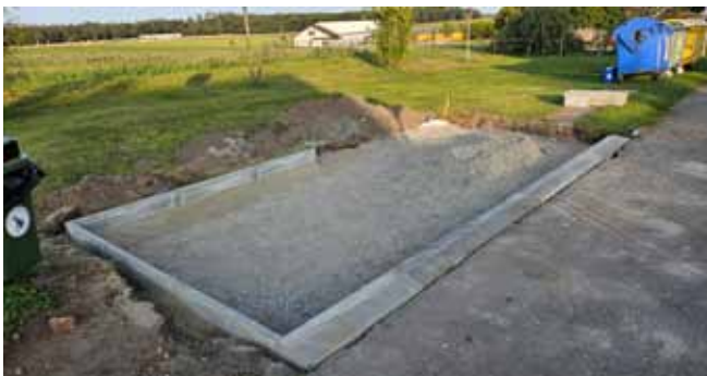
Sběrné místo na Stránce - průběh prací