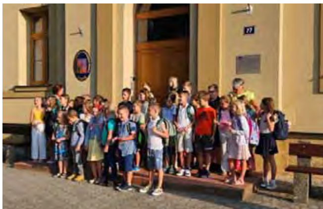
První školní den a přivítání prvňáčků

Celému zahájení byl přítomen zástupce firmy Dragon Internet a.s., který donesl prvňáčkům také dárky a televize 1.boleslavská pořídila z tohoto dne reportáž. Můžete si ji prohlédnout na našich webových stránkách.