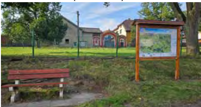
ZŠ Čistá - nová Cyklo mapa před budovou ZŠ

Parčík u Kulturního domu, nová stojanová Cyklo-mapa, úprava prostor: také na tomto místě jsme nově umístili Cyklo-mapu a celkově jsme tento prostor vylepšili pokládkou nové zámkové dlažby.