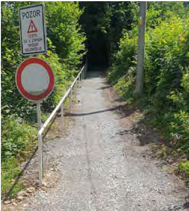
Cesta pod ZŠ - dokončení opravy cesty

Úprava příkopů podél místních komunikací: v průběhu prázdnin jsme také kompletně zrevidovali příkopy podél místních komunikací. Děkujeme Milane a Jardo za provedení těchto potřebných prací před deštivým a zimním obdobím.