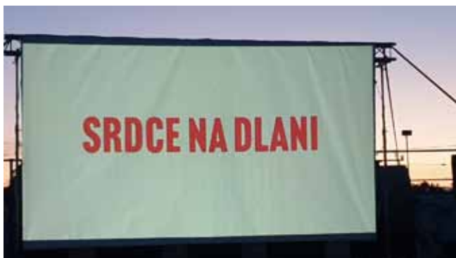
Červencové Letní putovní kino v Čisté - právě začínáme