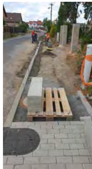
Chodník podél místní komunikace - Průběh prací na propojení chodníků