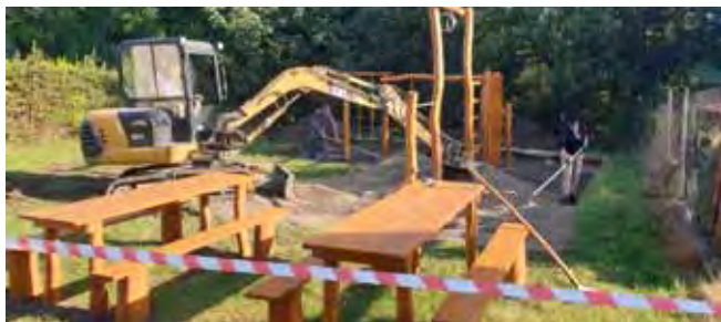
Prolézací treňažér v ZŠ - práce na dopadové ploše