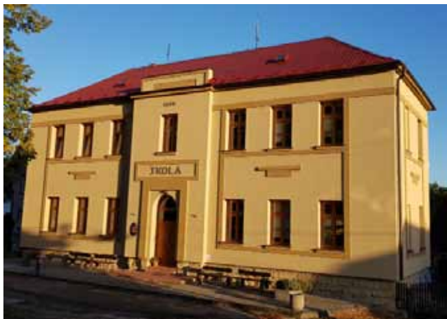
ZŠ ČISTÁ - Po dokončení rekonstrukce

Rekonstrukce budovy ZŠ – Snížení energetické náročnosti objektu ZŠ v obci Čistá č.p. 77 – akce dokončena v listopadu 2018;