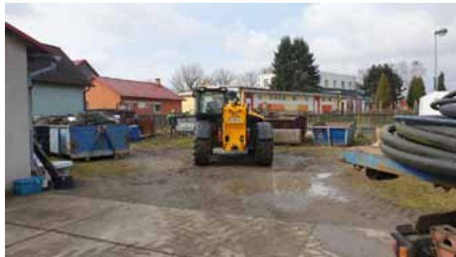
MODERNIZACE SBĚRNÉHO DVORA - před zahájením prací