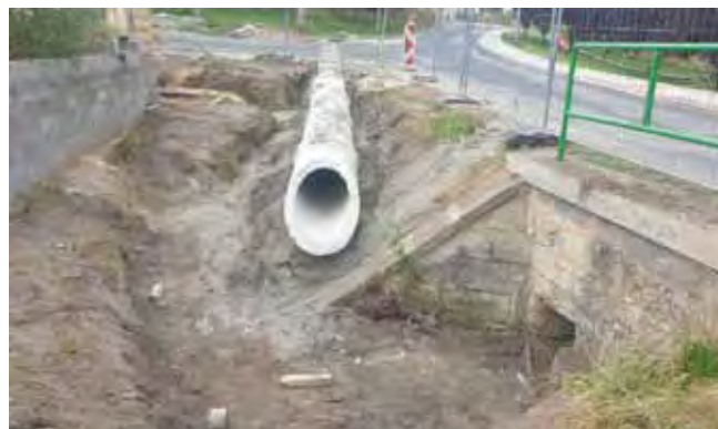
Chodník budovaný společností Reality Čistá - zahájení prací