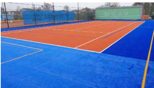
VÍCEÚČELOVÉ HŘIŠTĚ - Po dokončení díla

Chodník podél místní komunikace – I. etapa, Veřejné osvětlení nového chodníku – 1. a 2. část (od Pomníku k místní Poště) – stavební práce byly zahájeny v listopadu 2021, stavební část chodníku a převážná část Veřejného osvětlení byla dokončena v srpnu 2022. Do uzávěrky tohoto zpravodaje nebyla prozatím dokončena realizace 2ks lamp Veřejného osvětlení u čp. 278;