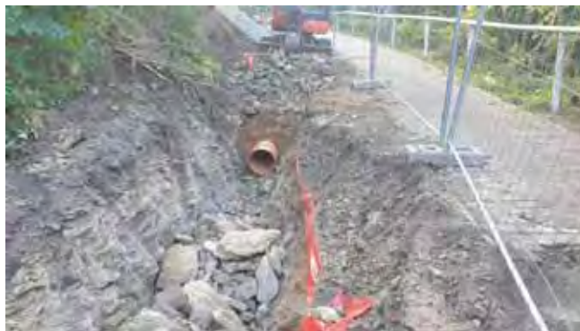
Dešťová kanalizace Stránka - průběh prací