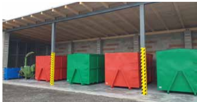
MODERNIZACE SBĚRNÉHO DVORA - Po dokončení stavby a dodání vybavení