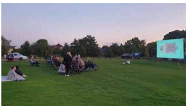
Červencové Letní putovní kino v Čisté - před zahájením promítání