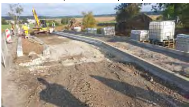
Autobusový záliv Stránka - průběh prací