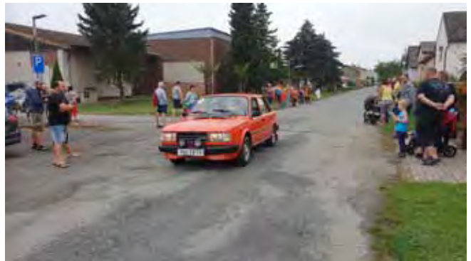
VALOTOUR 2022 - světově známá značka a nadšení příznivci