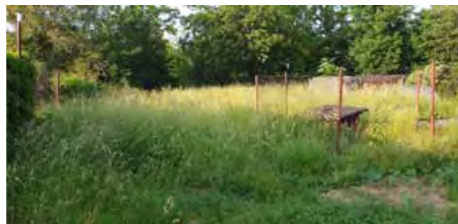
ZŠ Čistá - původní stav prostoru pro Prolézací trenažér