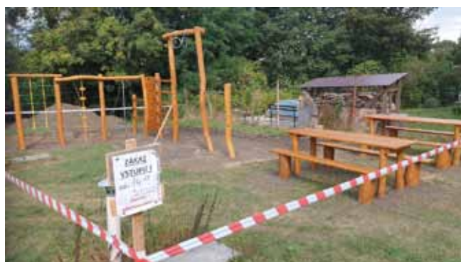
Prolézací trenažér v ZŠ - dokončení montáže