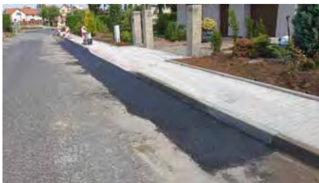
Chodník podél místní komunikace - Dokončení prací na propojení chodníků u č. p. 278