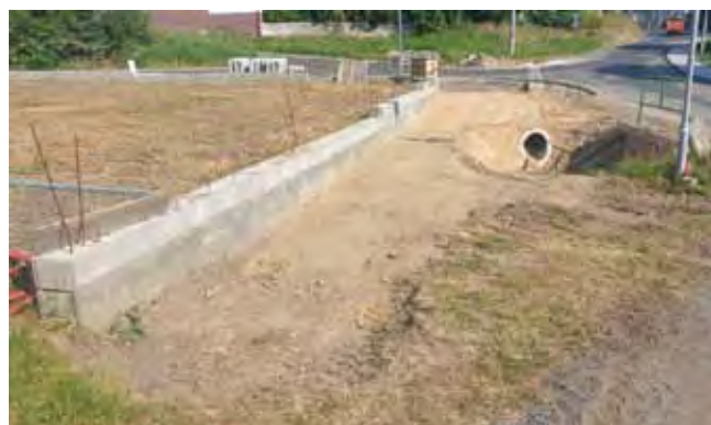
Chodník budovaný společností Reality Čistá - průběh prací