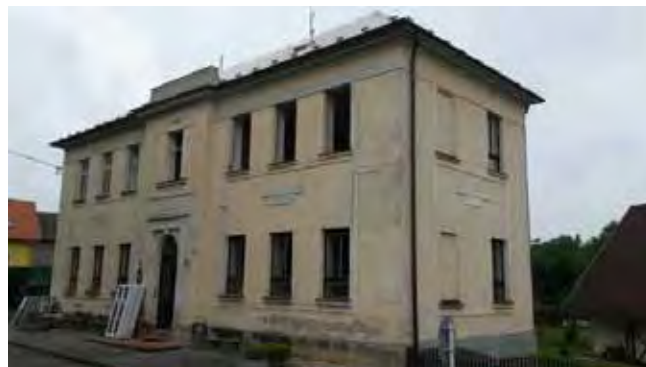
ZŠ ČISTÁ - Před zahájením rekonstrukce

Nyní vám tedy připomenu, které stavební projekty a ostatní činnosti jsme realizovali ve výše uvedeném období.