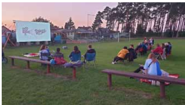
Srpnové Letní putovní kino v Čisté