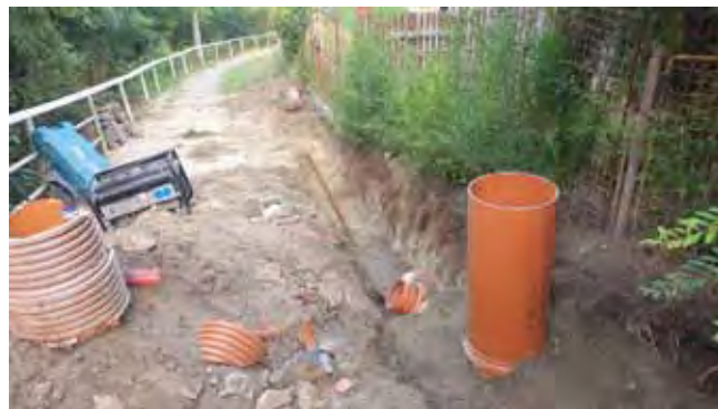
Dešťová kanalizace Stránka - zahájení prací