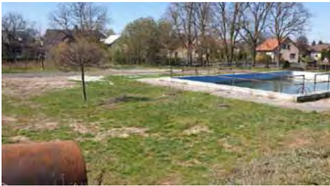
WORKOUTOVÉ HŘIŠTĚ - Před zahájením prací