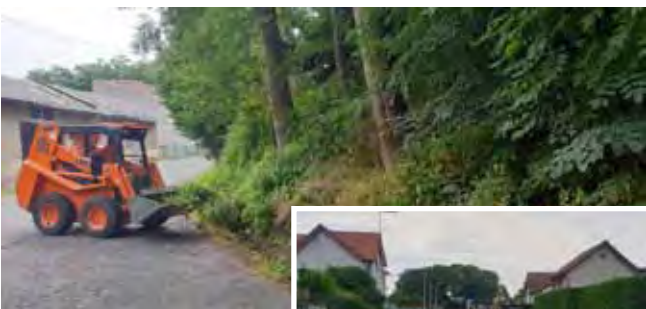
Úprava příkopů - pod Zahradnictvím