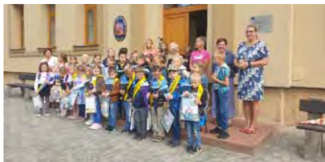
Zahájení nového školního roku - v popředí naši noví prvňáčci

Za Kulturní výbor Danuše Horáčková