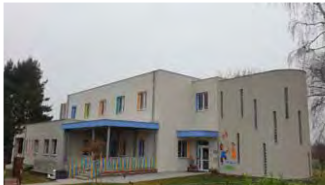
MŠ ČISTÁ - Po dokončení Stavebních úprav, přístavby a nástavby

Rozšíření MŠ v Čisté – Vnitřní vybavení, herní prvky – akce smluvně zahájena v září 2020 a kompletní dodání a předání vybavení realizováno v květnu 2021;