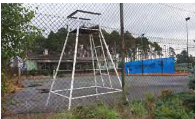
VÍCEÚČELOVÉ HŘIŠTĚ - Před zahájením prací