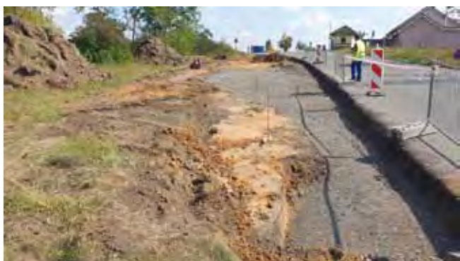
Autobusový záliv Stránka - průběh prací