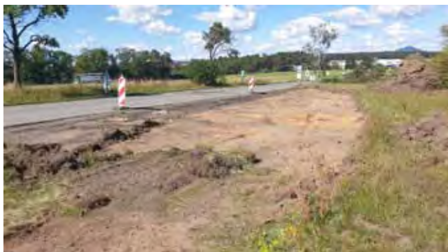
Autobusový záliv Stránka - zahájení prací na novém nástupišti