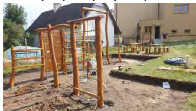
Prolézací trenažér v ZŠ - průběh prací