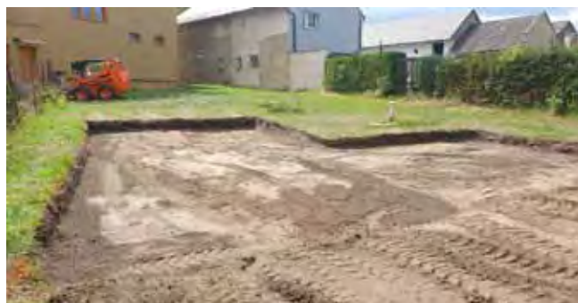
Prolézací trenažér v ZŠ - úprava prostoru pro dopadovou plochu