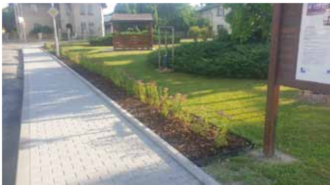
CHODNÍK PODÉL MÍSTNÍ KOMUNIKACE - Po ukončení stavby

Tyto významné projekty byly všechny podpořeny dotacemi, a to v celkové výši 22, 236, 753,-Kč!