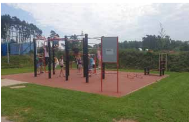
WORKOUTOVÉ HŘIŠTĚ - Po dokončení díla