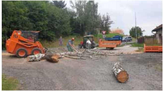
Kácení suchých stromů v havarijním stavu

Kácení stromů v havarijním stavu: také jsme z důvodu bezpečnosti pokáceli stromy, které již byly suché a hrozil jejich pád.