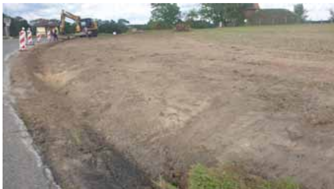
Autobusový záliv Stránka - dokončení úpravy terénu z důvodu rozhledových poměrů