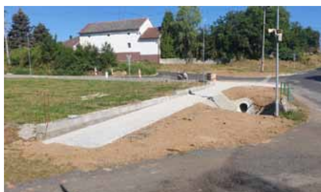
Chodník budovaný společností Reality Čistá - před dokončením