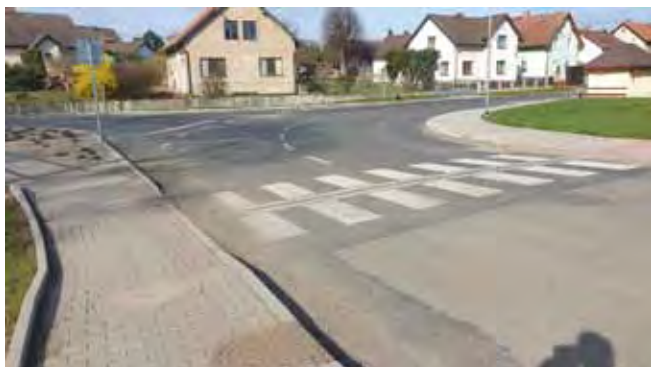
CHODNÍK PODÉL HLAVNÍ SILNICE - Po dokončení stavby

Mateřská školka – Stavební úpravy, přístavba a nástavba MŠ v Čisté za účelem zvýšení kapacity – stavební práce byly zahájeny v květnu 2020 a stavba byla dokončena a předána v červnu 2021;