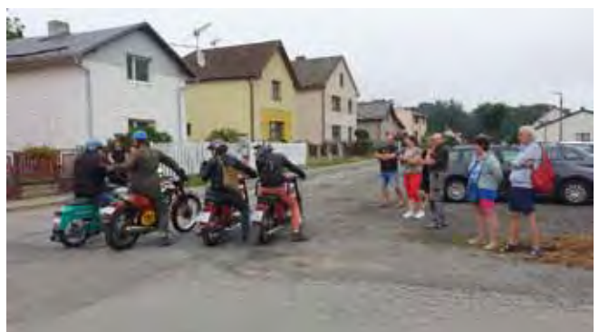
VALOTOUR 2022 - závod motocyklistů