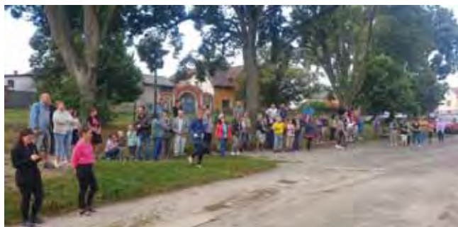
Zahájení nového školního roku