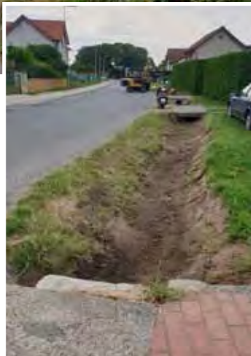
Úprava příkopů - podél Hlavní silnice

Kácení stromů v havarijním stavu: také jsme z důvodu bezpečnosti pokáceli stromy, které již byly suché a hrozil jejich pád.