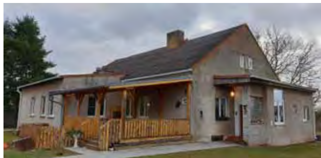
MŠ ČISTÁ - Před zahájením modernizace

Mateřská školka – Stavební úpravy, přístavba a nástavba MŠ v Čisté za účelem zvýšení kapacity – stavební práce byly zahájeny v květnu 2020 a stavba byla dokončena a předána v červnu 2021;