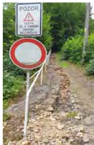
Cesta pod ZŠ - následky přívalového deště

Odstranění následků přívalového deště / čištění koryta od naplavenin, odstranění náletových křovin, zpevnění splavené cesty pod ZŠ v obci Čistá: ve čtvrtek 7.7. 2022 jsme v obci Čistá zaznamenali silný přívalový déšť, který měl za následky výrazné poškození cesty pod ZŠ Čistá. Ihned v následujícím týdnu se nám podařilo cestu opravit.