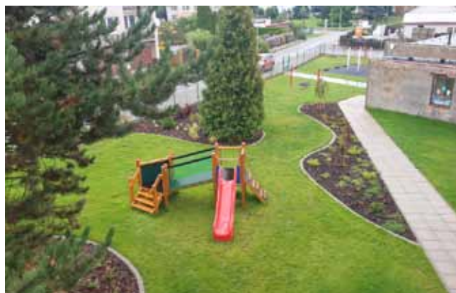
MŠ ČISTÁ - Herní prvky, zahrada

Vybudování workoutového hřiště a víceúčelového hřiště s umělým povrchem ve sportovním areálu – akce zahájena v září 2020 a obě sportoviště byla předána veřejnosti v listopadu 2020;