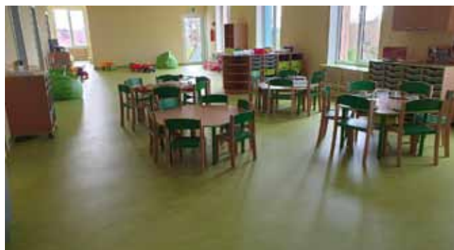
MŠ ČISTÁ - Vnitřní vybavení

Rozšíření MŠ v Čisté – Vnitřní vybavení, herní prvky – akce smluvně zahájena v září 2020 a kompletní dodání a předání vybavení realizováno v květnu 2021;