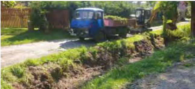
Úprava příkopů - údolí u Vodárny

Úprava příkopů podél místních komunikací: v průběhu prázdnin jsme také kompletně zrevidovali příkopy podél místních komunikací. Děkujeme Milane a Jardo za provedení těchto potřebných prací před deštivým a zimním obdobím.