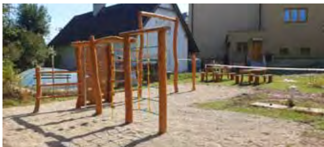
Prolézací treňažér v ZŠ - před dokončením prací