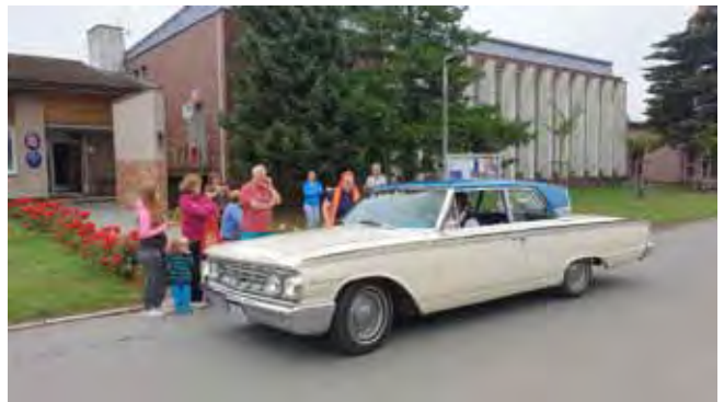
VALOTOUR 2022 - přijela také zahraniční vozidla

VALOTOUR 2022: v sobotu, 27. 8. 2022 projížděly naší obcí historická vozidla v rámci 10. ročníku VALOTOUR 2022. Kontrolní stanoviště bylo u OÚ Čistá a tento průjezd „závodních“ vozidel shlédli velký počet přihlížejících.