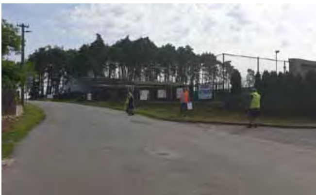
CHODNÍK PODÉL HLAVNÍ SILNICE - Před zahájením stavby

Chodník podél hlavní silnice III/27234 s úpravou křižovatky u Pomníku vč. vybudování dvou autobusových zálivů – stavební práce byly zahájeny v červenci 2019 a stavba byla dokončena v listopadu 2019;