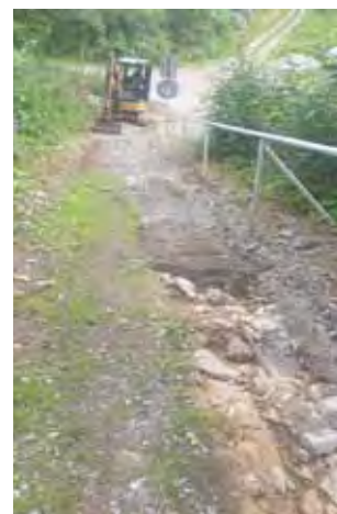
Cesta pod ZŠ - zahájení prací na opravě cesty