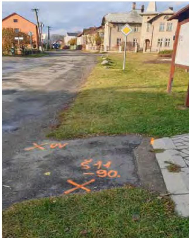
CHODNÍK PODÉL MÍSTNÍ KOMUNIKACE - Před zahájením prací

Chodník podél místní komunikace – I. etapa, Veřejné osvětlení nového chodníku – 1. a 2. část (od Pomníku k místní Poště) – stavební práce byly zahájeny v listopadu 2021, stavební část chodníku a převážná část Veřejného osvětlení byla dokončena v srpnu 2022. Do uzávěrky tohoto zpravodaje nebyla prozatím dokončena realizace 2ks lamp Veřejného osvětlení u čp. 278;