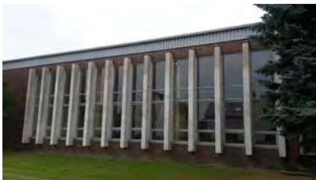
Výměna oken na sále KD - dokončení