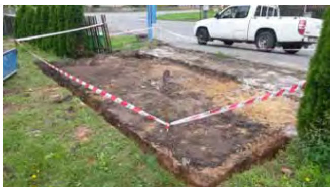
Nová autobusová zastávka Čistá - hřiště, zahájení prací