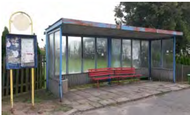
Stará autobusová zastávka Čistá - hřiště