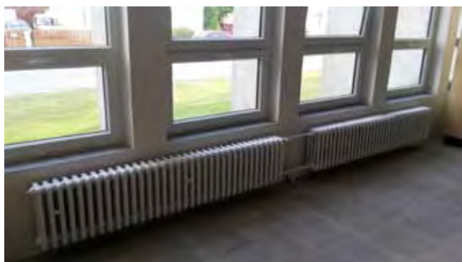
Malby sál KD - nátěry topení, parapety