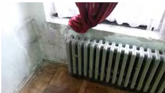
Malby sál KD - před zahájením