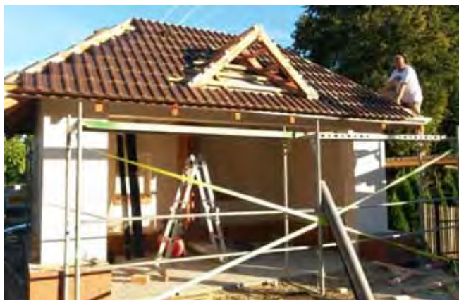
Nová autobusová zastávka Čistá - hřiště, střecha před dokončením