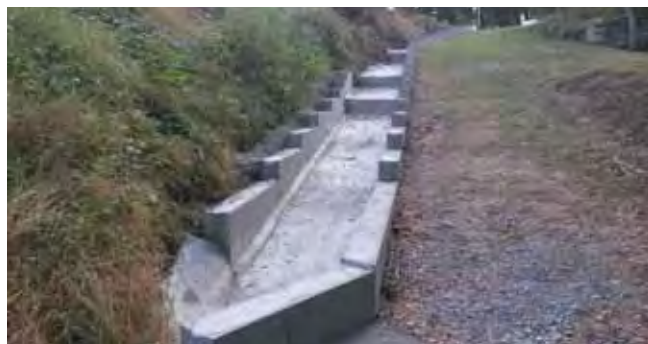
Oprava vodoteče pod ZŠ - před dokončením