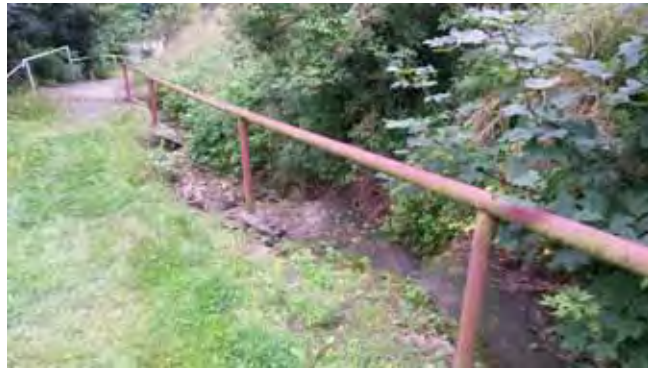
Oprava vodoteče pod ZŠ - starý stav