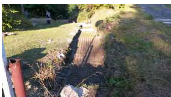
Oprava vodoteče pod ZŠ - průběh prací