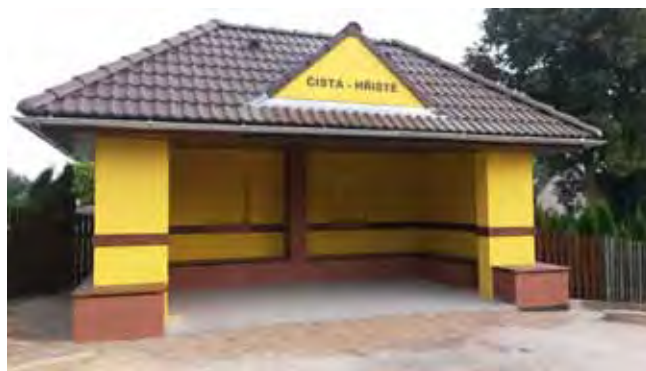
Nová autobusová zastávka Čistá - hřiště, dokončení