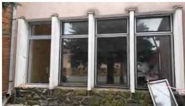
Výměna oken na sále KD - zahájení prací