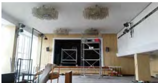
Malby Sál KD - mytí světe