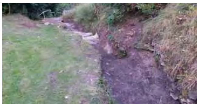
Oprava vodoteče pod ZŠ - zahájení