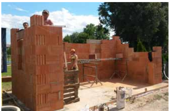
Nová autobusová zastávka Čistá - hřiště, průběh prací