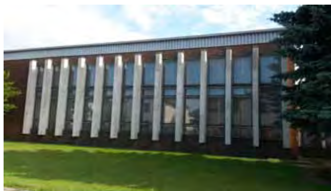
KD Čistá - stará okna