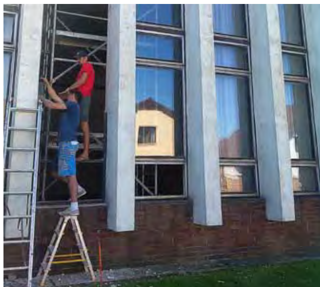
Výměna oken na sále KD - průběh prací