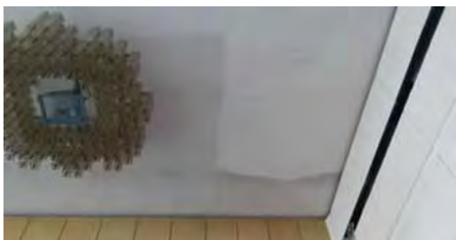
Malby sál KD - zahájení