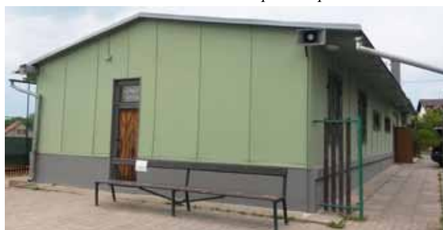
Restaurace na hřišti – před dokončením oprav fasády