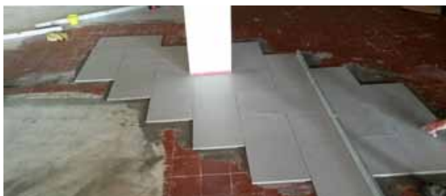
Restaurace KD – po dokončení opravy podlahy, topení, maleb