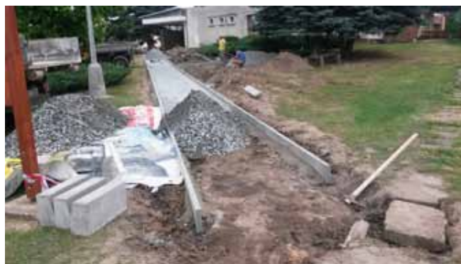
Chodník v parčíku u KD – průběh práce

- Dne 22. 6. 2017 byly zahájeny práce na 1. etapě opravě chodníku „Od schodiště vstupu do KD přes přílehlý parčík“. Práce byly ukončeny dne 1. 7. 2017 (cena 138 910,- Kč bez DPH). Dne 2. 7. 2017 byly zahájeny práce na 2. etapě „Oprava zpevněné plochy před vstupem do KD, oprava chodníku pro bezbariérový vstup, provedení odvodnění části střechy a provedení vsaku“. Práce byly ukončeny dne 11. 7. 2017 (cena 90 538,- Kč bez DPH). Dále byly namontovány v těchto prostorech nové lavičky.