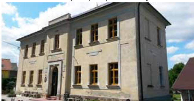
ZŠ – výměna oken – dokončení 1. etapa