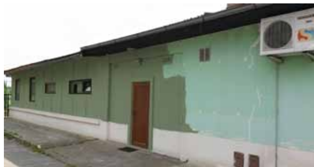
Restaurace na hřišti – průběh prací