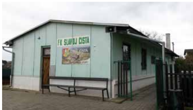
Restaurace na hřišti – starý stav před zahájením prací

– jenom pro připomenutí, protože jste jistě již zaregistrovali, že v měsíci květen 2017 byla také provedena „Oprava nátěru fasády, soklu, ocelových a klempířských prvků a ostatní stavební činnosti“ (cena 61.683,- Kč bez DPH). Práce byly ukončeny a dílo předáno 31. 5. 2017.