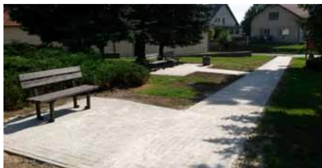
Chodník v parčíku u KD – po dokončení