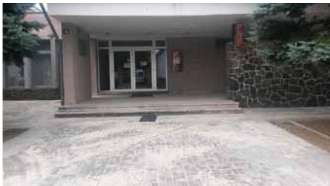
Chodník u KD – dokončení