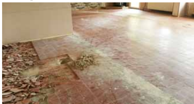
Restaurace KD – zahájení prací

– dne 25. 07. 2017 byly zahájeny demontážní a bourací práce staré podlahové krytiny, byla opravena část stávající podlahy, byly provedeny stavební připomoci pro rekonstrukci topení a výměna rozvodů části topení a doplněny nové radiátory, byly upraveny rozvody elektro a osvětlení, poté byla provedena výmalba (zajistil si p. Kubát) a na závěr byla provedena pokládka nové dlažby. Práce byly ukončeny dne 27. 8. 2017. V závěrečné etapě (7. – 8. 9. 2017) byly provedeny ve vstupním vestibulu opravy stropního osvětlení, opravy omítek, nátěry topení a byla provedena nová výmalba daného prostoru.