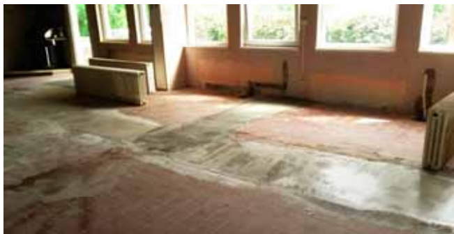
Restaurace KD – průběh prací – topení