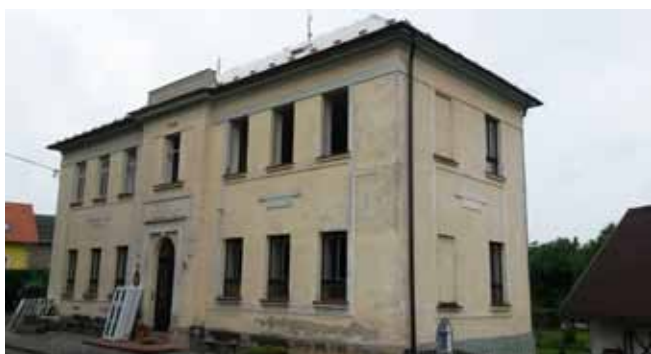
ZŠ – zahájení výměny oken 1. etapa

- dne 11. 7. 2017 byla provedena 1. etapa výměny oken v průčelí budovy (pořizovací cena po sjednaných slevách 168.660,- Kč bez DPH), poté dne 21. 8. 2017 byla provedena 2. etapa – výměna oken na štítové zdi