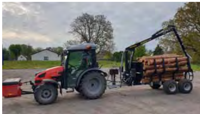
Nový vyvážecí vlek pro práce v lese - již v provozu

Nový Vyvážecí vlek a nový Žací traktor: v jarním období jsme pro potřeby obce pořídili pro práce v lese nový Vyvážecí vlek a pro údržbu travnatých ploch v obci také nový Žací traktor.