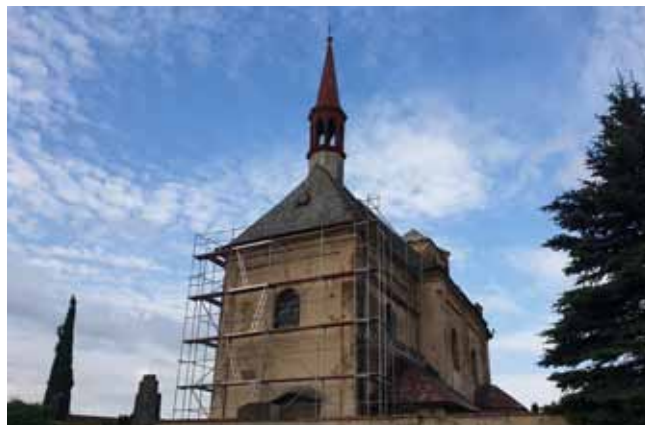
Kostel sv. Vavřince - plánovaná oprava 1. části kostela