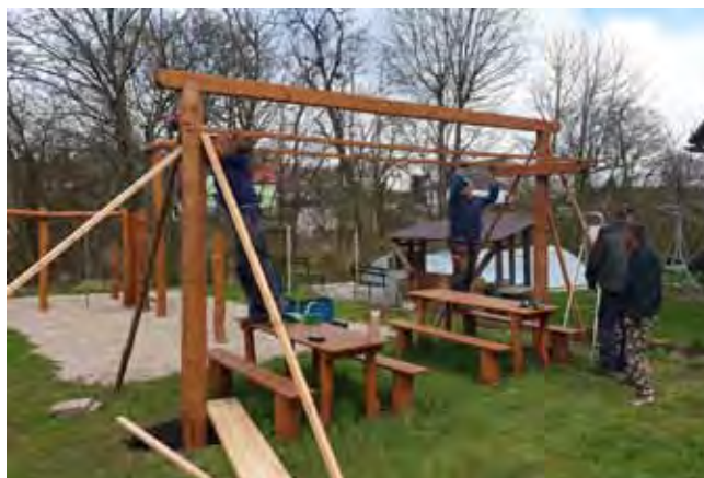
ZŠ Čistá - vybudování nového přístřešku pro žáky - zahájení prací