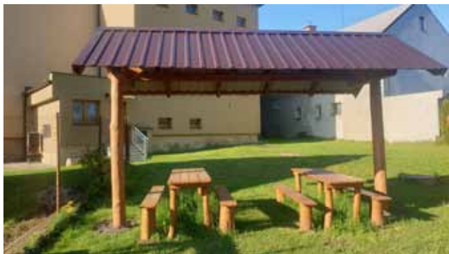
ZŠ Čistá - vybudování nového přístřešku pro žáky - dokončení prací, předání