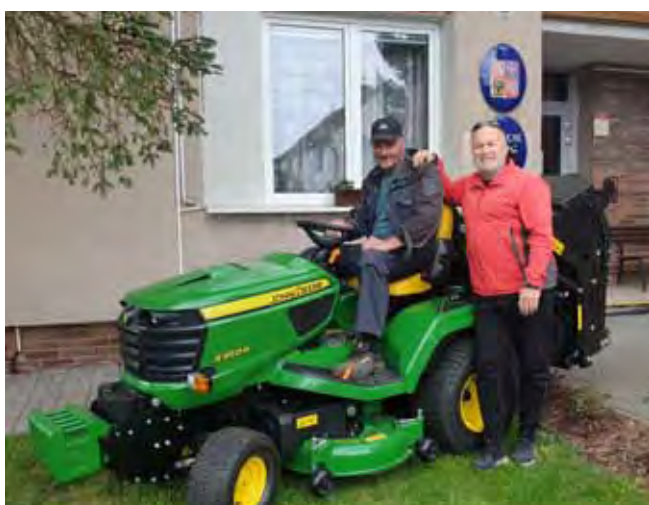
Nový žací traktor pro potřeby naší obce

Následná péče o výsadbu stromů: v jarních a letních měsících obecní zaměstnanci a pan místostarosta také pečují o nově vysázené stromy.