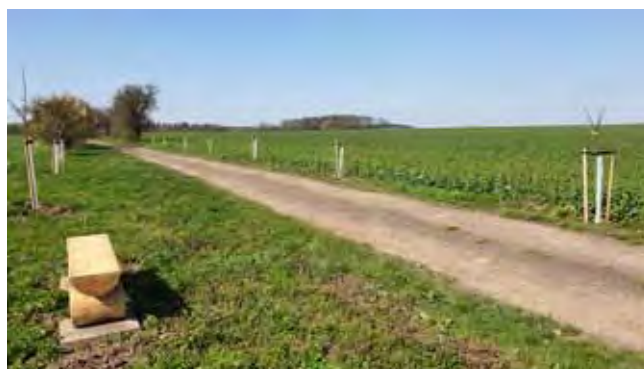
Výsadba stromků cesta Ke kalu - údržba a následná péče