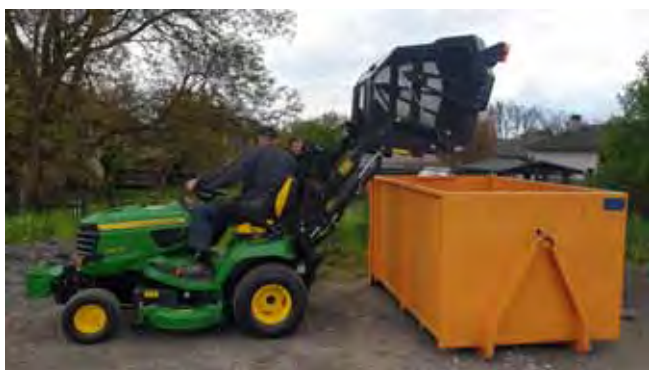
Nový žací traktor - technické možnosti stroje