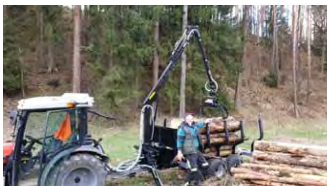
Nový vyvážecí vlek - spokojeni jsou také zaměstnanci obce