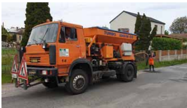
Oprava místních komunikací

průběhu měsíců května a června byly opraveny místní komunikace. Víme, že všechna místa nejsou opravena tzv. do ideální podoby, ale s přihlédnutím k tomu, že obec připravuje realizaci stavby splaškové kanalizace, rozhodli jsme se opravovat pouze nezbytně nutné.