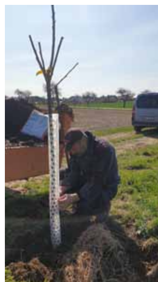
↳ Výsadba stromků cesta ke Kapličce - následná péče