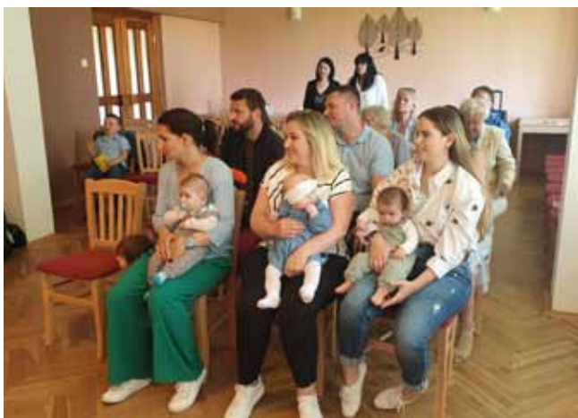
Přivítání nových občánků naší obce

V sobotu 27. 5. 2023 jsme dopoledne v salonku KD za přítomnosti pana starosty, členů Sboru pro občanské záležitosti, rodičů dětí a všech příbuzných, přivítali nové občánky. Stali se jimi děti s trvalým pobytem v naší obci.