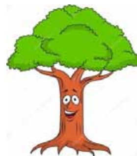
↳ Výsadba stromků cesta ke Kapličce - zálivka pana místostarosty