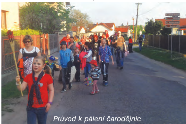
Průvod k pálení čarodějnic

Také v naší obci, jako každý rok, tak i letos vyšel v hojném počtu průvod s lampiony od KD k vatře s čarodějnicí připravené na hřišti. Současné pojetí „pálení čarodějnic“ je takové