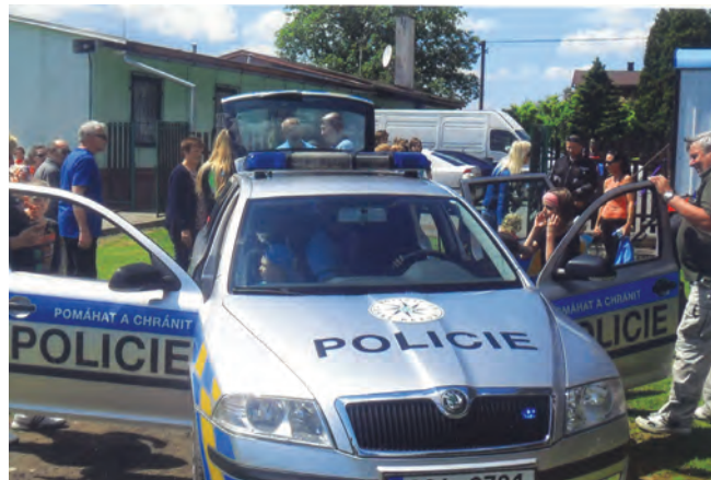
Dětský den 2014

večerní setkání sousedů, známých a dětí u ohně, spojené s opékáním buřtů a dobrou náladou do pozdních hodin. To se za pomoci hezkého počasí podařilo. Poděkování za přípravu patří Obecnímu úřadu a rodině Milerových.