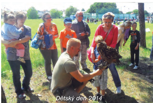
Dětský den 2014

Také v naší obci, jako každý rok, tak i letos vyšel v hojném počtu průvod s lampiony od KD k vatře s čarodějnicí připravené na hřišti. Současné pojetí „pálení čarodějnic“ je takové