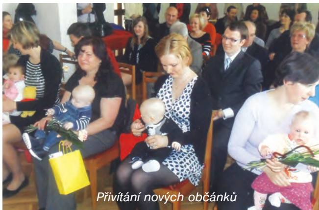
Přivítání nových občánek

čarodějnic. Na ochranu před čarodějnicemi se na vyvýšených místech pálili ohně. Postupem času se z výročních ohňů stalo „pálení čarodějnic“, aby byla ochráněna úroda a hospodářství před neúspěchem.