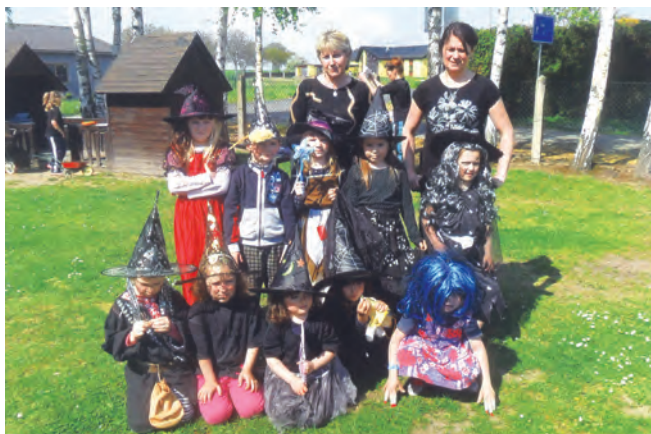
Slet čarodějnic ve školce

čarodějnic. Na ochranu před čarodějnicemi se na vyvýšených místech pálili ohně. Postupem času se z výročních ohňů stalo „pálení čarodějnic“, aby byla ochráněna úroda a hospodářství před neúspěchem.